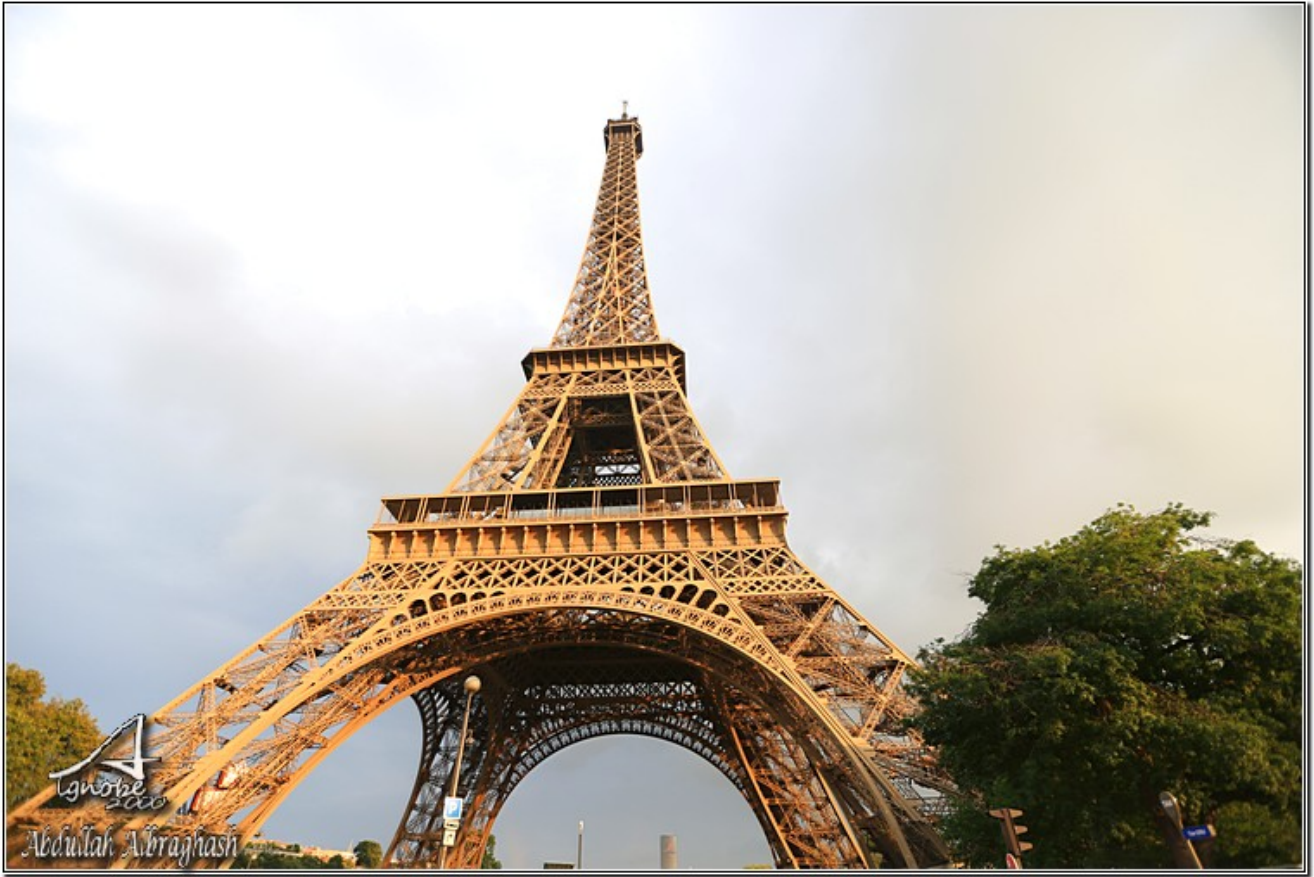
ونهر السين قريب جدا من برج ايفل بينهم شارع