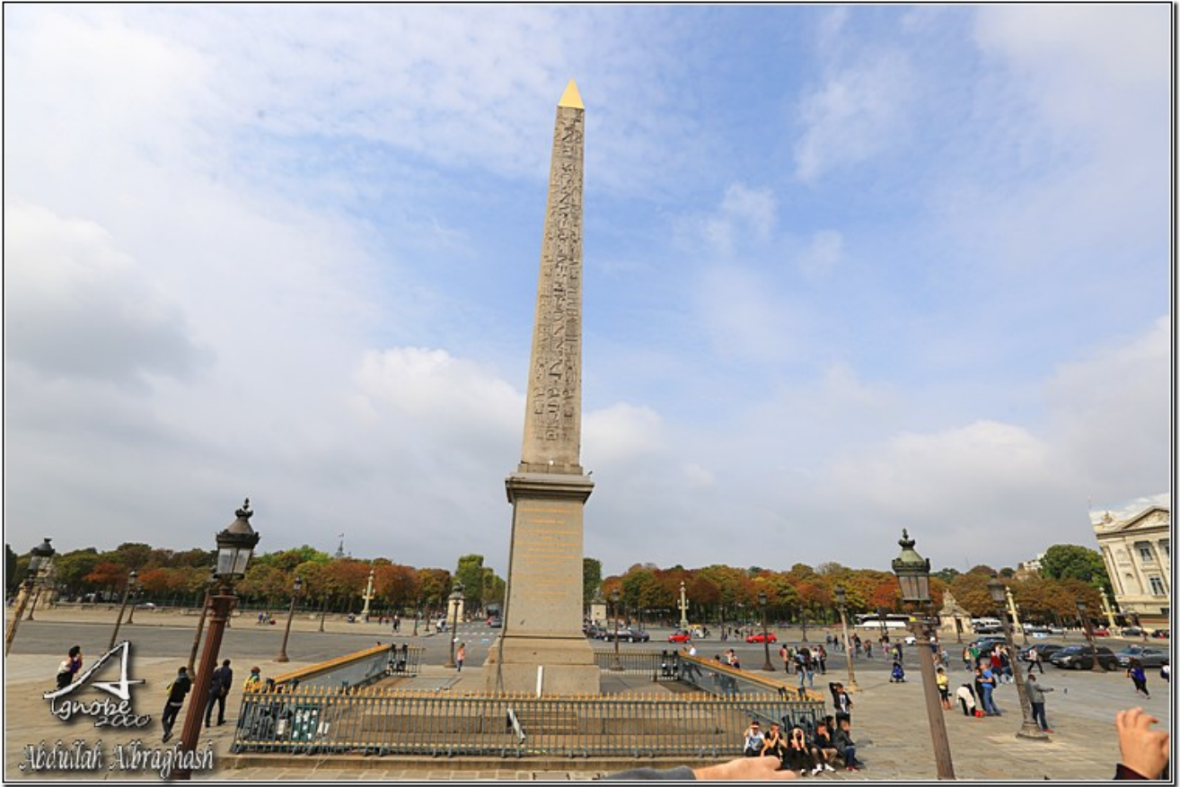
متحف اللوفر الشهير