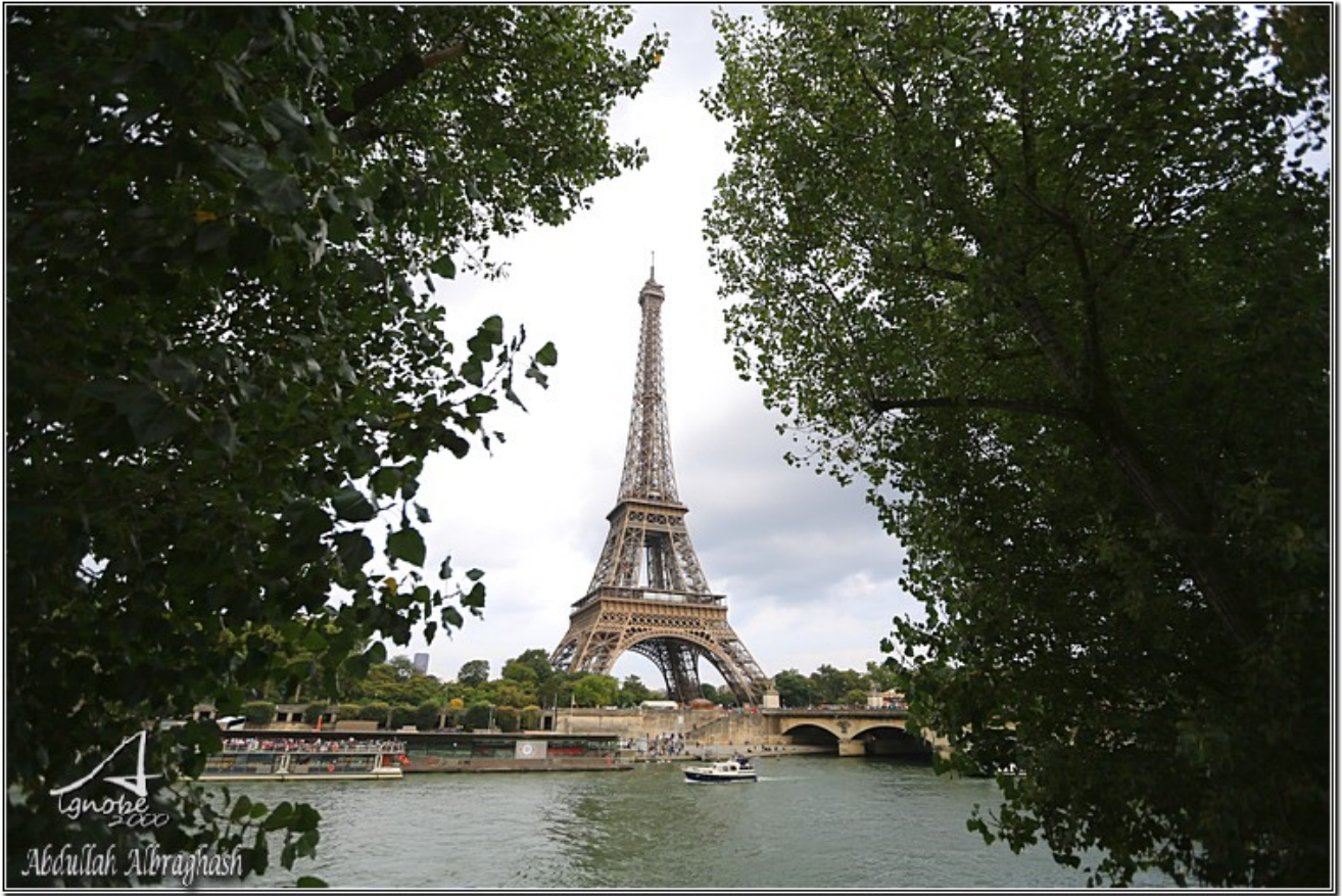
برج ايفل مع نهر السين